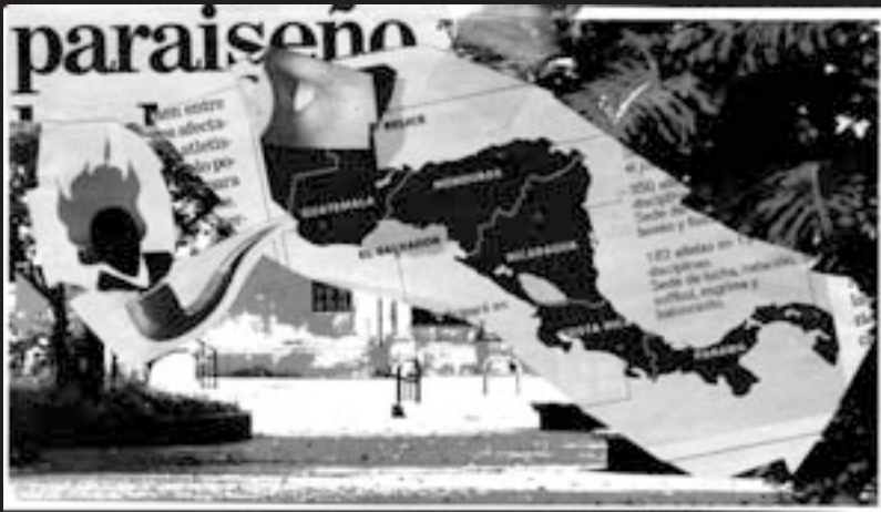
arriba: "paraiseño" abajo: "NUDOS TIRANOS"